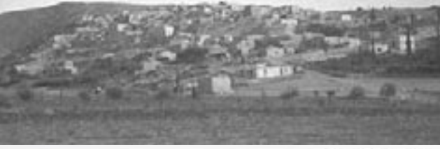
قرى قضاء القدس الحوية

قرية ديرابان عام ١٩٤٨، المدخل الغربي قبل التدمير